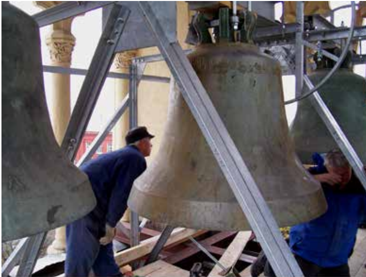
Das Geläute der ehemaligen Rheydter Friedenskirche im Turm der Ev.-Luth. Kathedrale St. Peter und Paul in Moskau

Sehr geehrter Herr Kollege, liebe Glaubensgeschwister in Moskau, im Namen der Evangelischen Kirchengemeinde Rheydt, die zur Stadt Mönchengladbach im Rheinland gehört, gratuliere ich Ihnen sehr herzlich zur Rückgabe der St. Peter und Paul-Kirche an die Ev.-Lutherische Kirche in Moskau und in Russland! Das ist sicherlich ein ganz großer Tag und ein wunderbares Zeichen der Hoffnung für Sie und Ihre Arbeit!